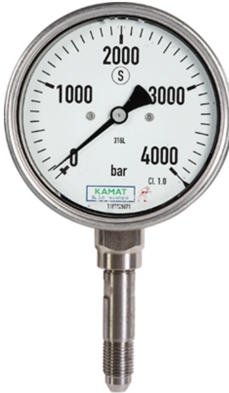
Kod No: 99.47.2110 0-4000 Bar 14x1.5 Sol Diş Alttan Çıkışlı Ø100

KAMAT SU JETİ TEKNOLOJİSİ MAKİNE İNŞ. SAN. ve TİC. LTD. ŞTİ.