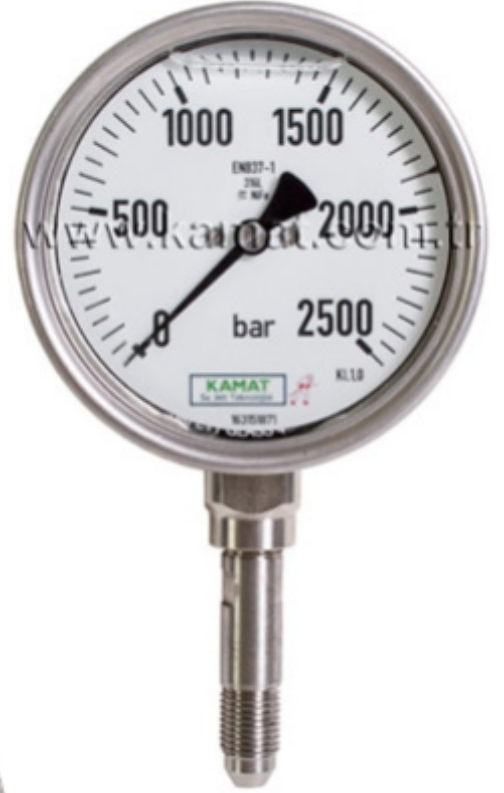
Kod No: 99.47.2101 0-2500 Bar 14x1.5 Sol Diş Alttan Çıkışlı Ø100