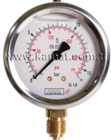
Kod No: 99.00.0002 0-16 Bar 1/4" Alttan Çıkışlı Ø63