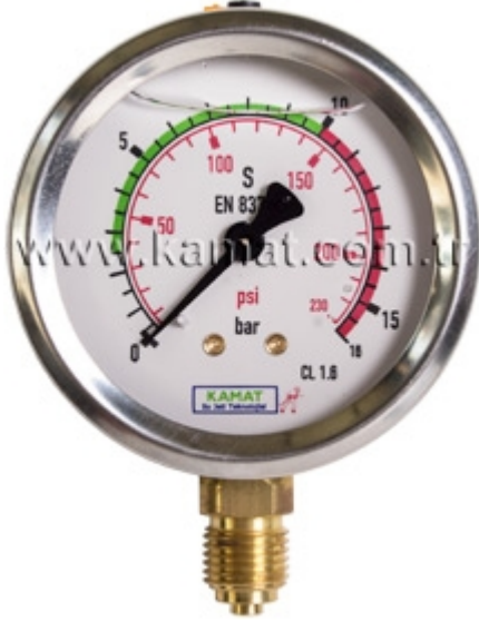
Kod No: 99.47.2010 0-16 Bar 1/4" Alttan Çıkışlı Ø63