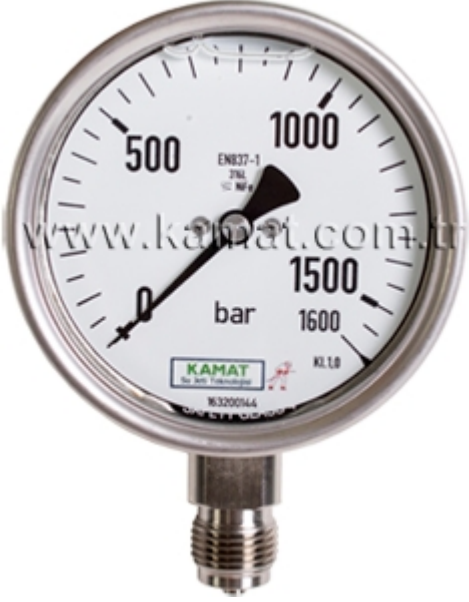
Kod No: 99.00.0013 0-1600 Bar 1/2" Alttan Çıkışlı Ø100