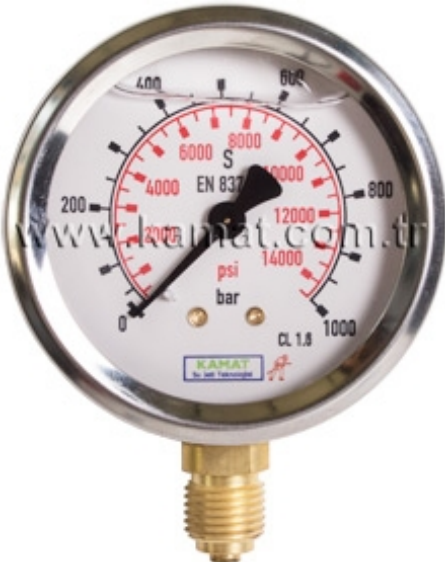
Kod No: 99.00.0022 0-1000 Bar 1/4" Alttan Çıkışlı Ø63